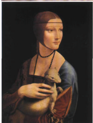
K známému obrazu Leonarda da Vinciho „Dáma s hranostajem“ stála modelem se vši pravděpodobností albinotická fretka, jak nasvědčují tělesné proporce zvířete.