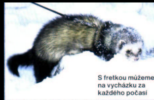
S fretkou můžeme na vycházku za každého počasí

Především musí být fretka zdravá a očkovaná. Očkování proti psince je naprostou nutností, protože ta pro fretky končí téměř vždy smrtelně a nakazit se mohou i bez přímého kontaktu s jiným zvířetem (kdo má fretky pouze doma, neměl by se